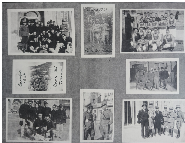
Anno scolastico 1924-25: gli allievi impegnati al campo estivo di Cava dei Tirreni, in attività sportive ed in visite istruttive.