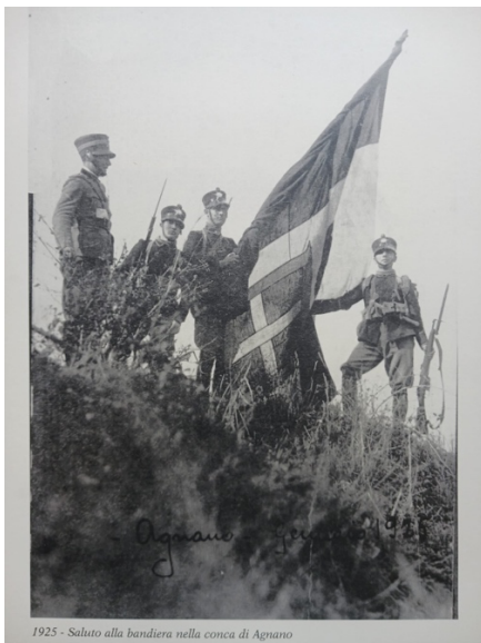
1925 - Saluto alla bandiera nella conca di Agnano