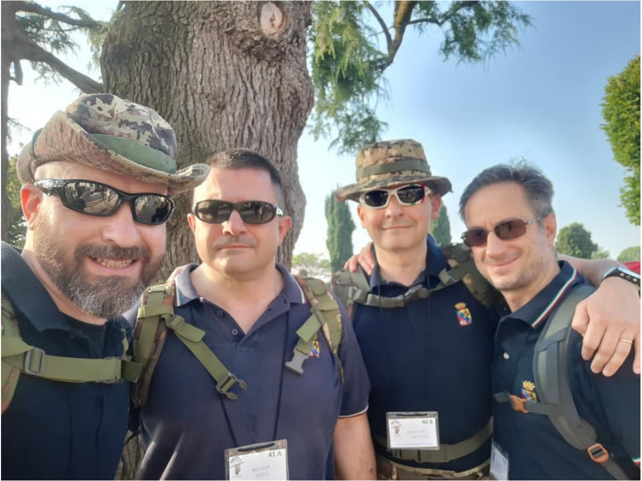
Foto 3 – ore 7.10. Pochi istanti ci separano dall'inizio della Zavorrata. Gli animi sono carichi, ma la cosa più bella è la felicità del trovarsi e nel ritrovarsi con lo stesso spirito di tanti anni fa!!!